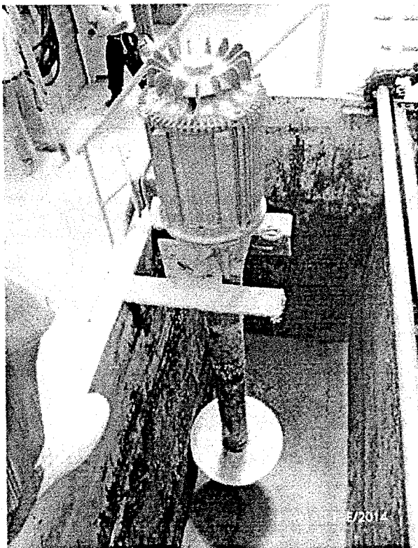
Trampa de grasa exterior