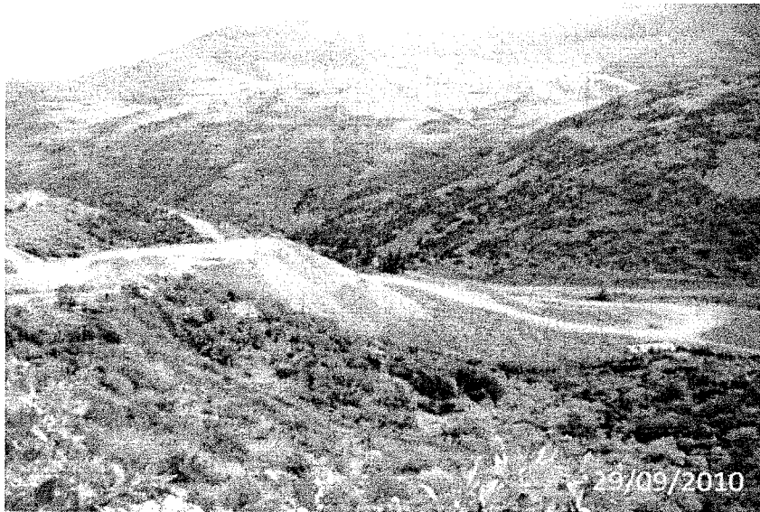
FOTOGRAFÍA N° 10: OBSERVACIÓN N° 10: Depósito de desmontes que no está considerado en el EIA, no cuenta con letrero de identificación, no tiene el diseño correspondiente.