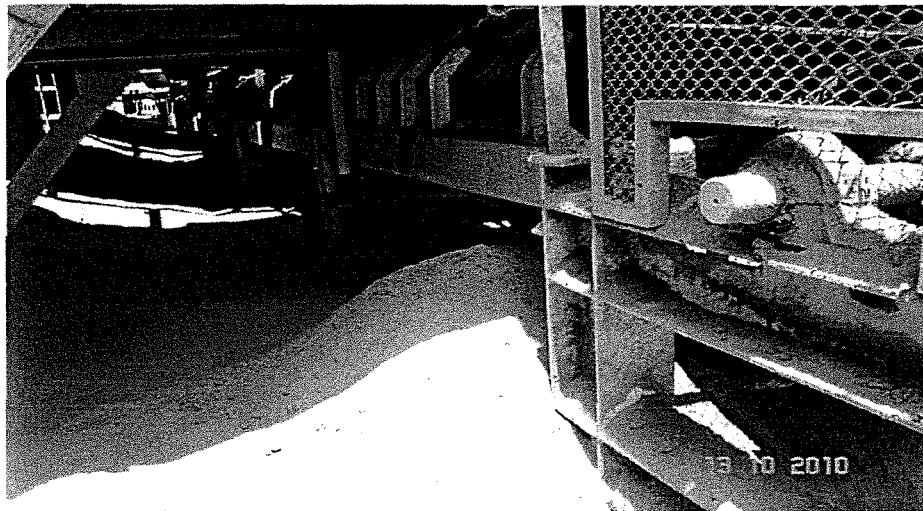
Foto 25: Acumulación de polvos finos en piso y estructuras procedentes de las fajas transportadoras de mineral chancado.