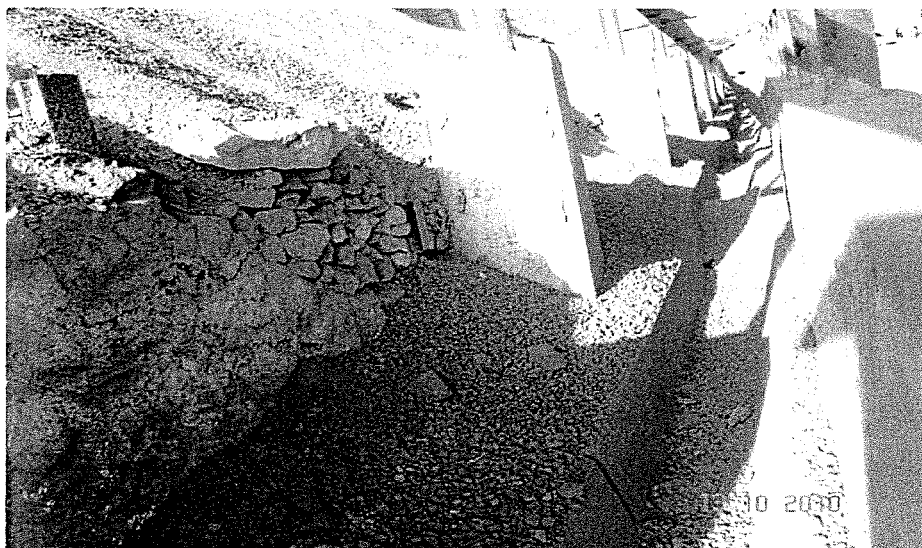
Foto 26: Deslizamientos de ripios hacia el canal de contingencia de la línea de relave en el tramo del depósito de ripios.