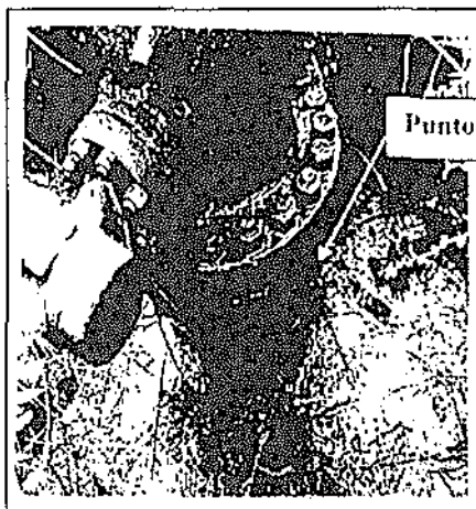
Fotografía N° 2 de la Carta PPN-EHS-11-203 de PLUSPETROL NORTE (original en blanco y negro)