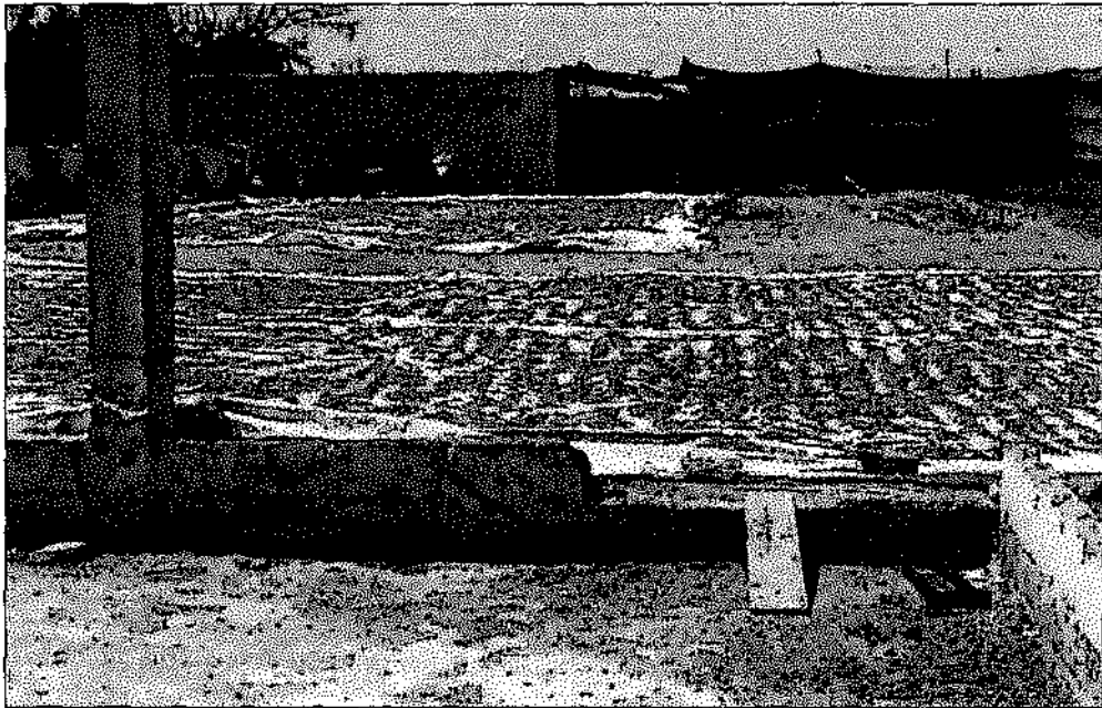
FOTO N° 26: MANTAS DE POLIETILENO TENDIDAS EN EL SUELO SOBRE EL CUAL SE REALIZA EL SECADO DE LOS RESIDUOS DE PESCADO A LA INTEMPERIE

Expediente N° 269-2011-PRODUCE/DIGSECOVI-Dsvs