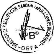
Cuadro N° 3