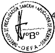
Cuadro N° 1