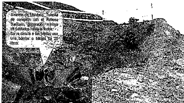
Fotografía 04: Sistema de lixiviados

El sistema de lixiviados es por recirculación para generar mayor cantidad de biogás de manera manual.