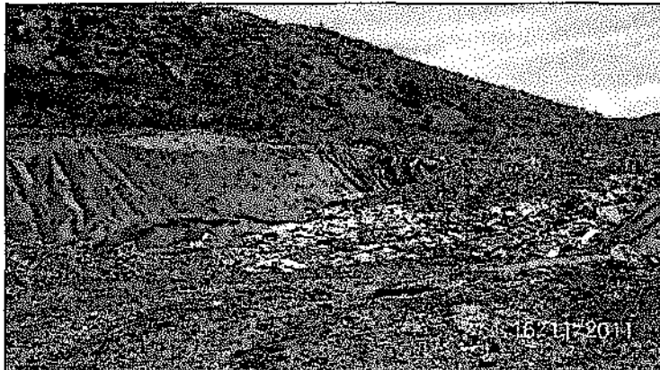
Foto N° 08: Vista del relleno sanitario doméstico, le falta cerco perimétrico, tubos de evacuación de gases y sistema de manejo de lixiviados. Observación N° 07, Supervisión Ambiental 2011.