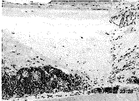
"Foto N° 16: Vista del dique del depósito de relaves. Dentro del círculo rojo se observa la zona de contacto del relave con el suelo natural, no hay presencia de impermeabilización (geomembrana y/o geotextil)."