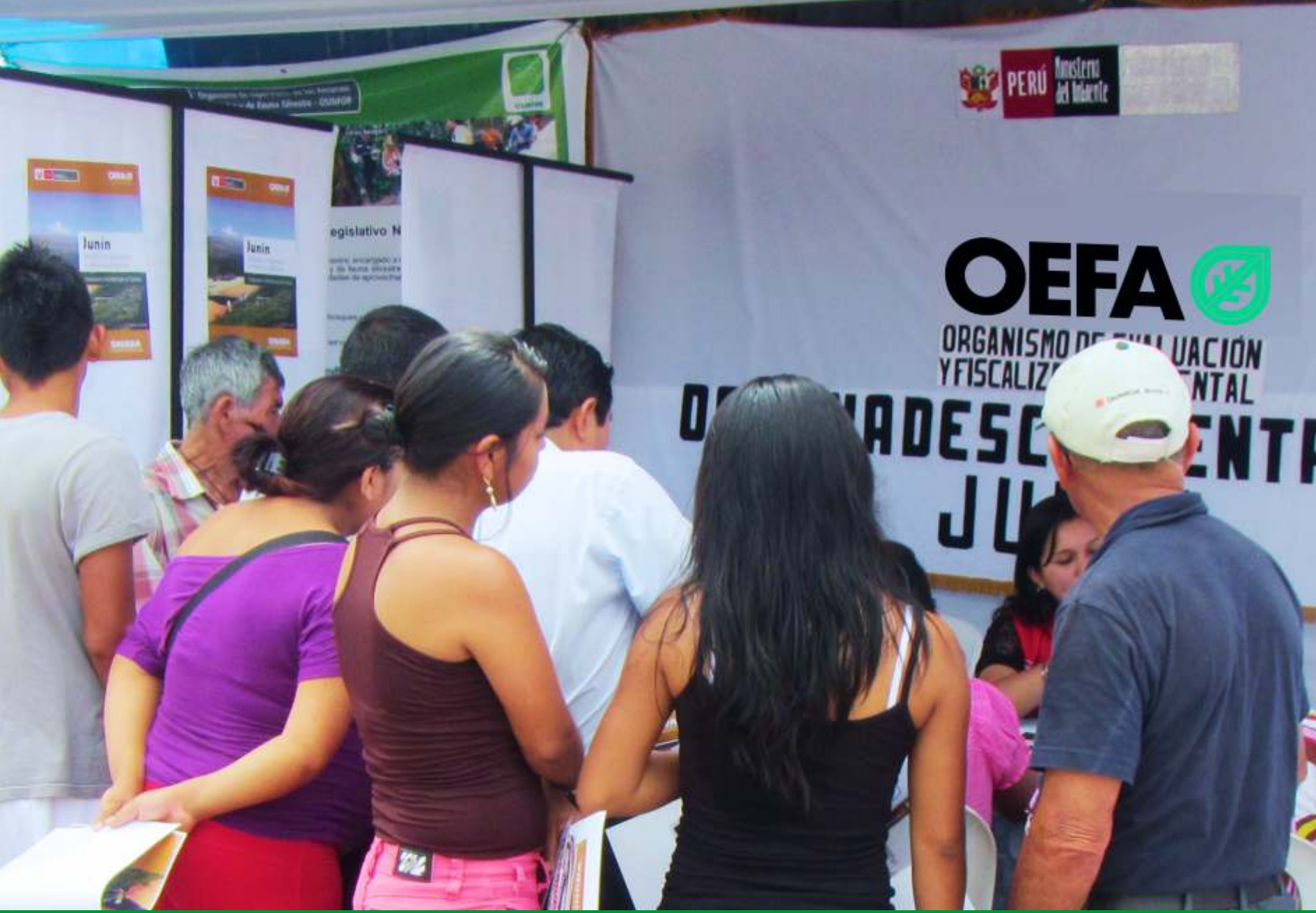
El OEFA sensibilizó a la población de Pichanaqui sobre la importancia de la fiscalización ambiental en la selva central