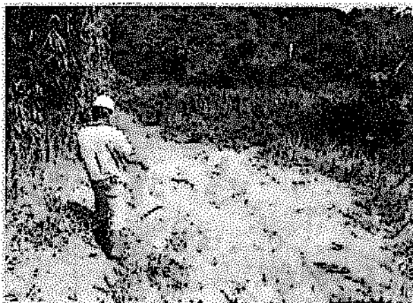
Se observa la siembra de semillas de pajapichi al voleo en áreas desprotegidas por causa de las