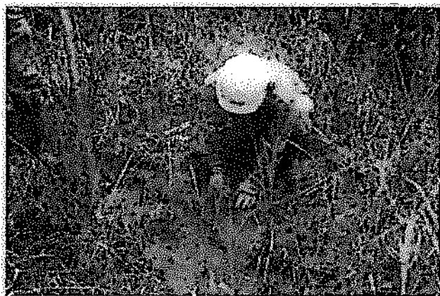
En la imagen se observa a trabajador local realizando la siembra de plánton forestal en área de trabajo.