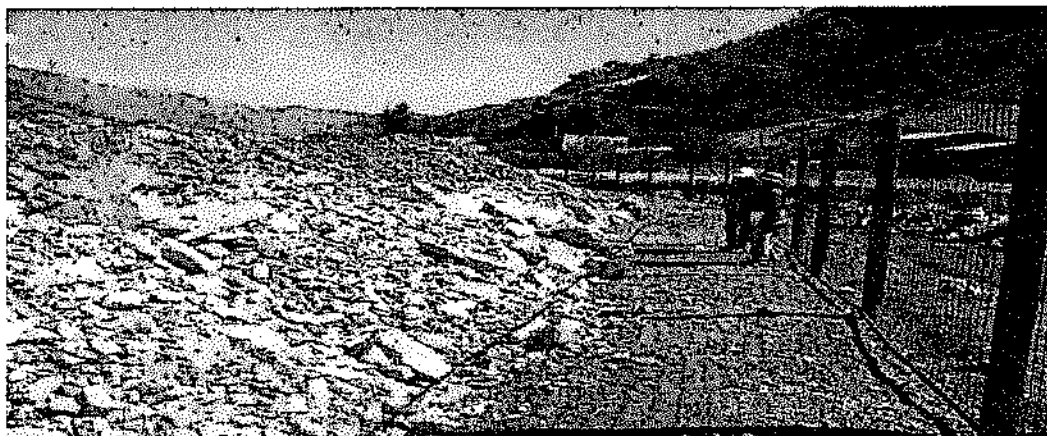
Fotografía N° 44: Vista del material de desmonte dispuesto en rumas a unos 2 metros aprox. del cerco perimétrico que limita con el río Huallaga.