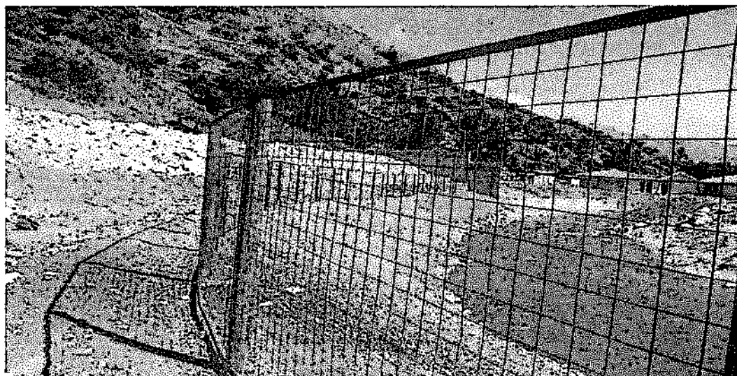
Fotografía N° 47: Vista de la disposición de desmonte en la zona de la Quinua, se observa la parte final del área de disposición.