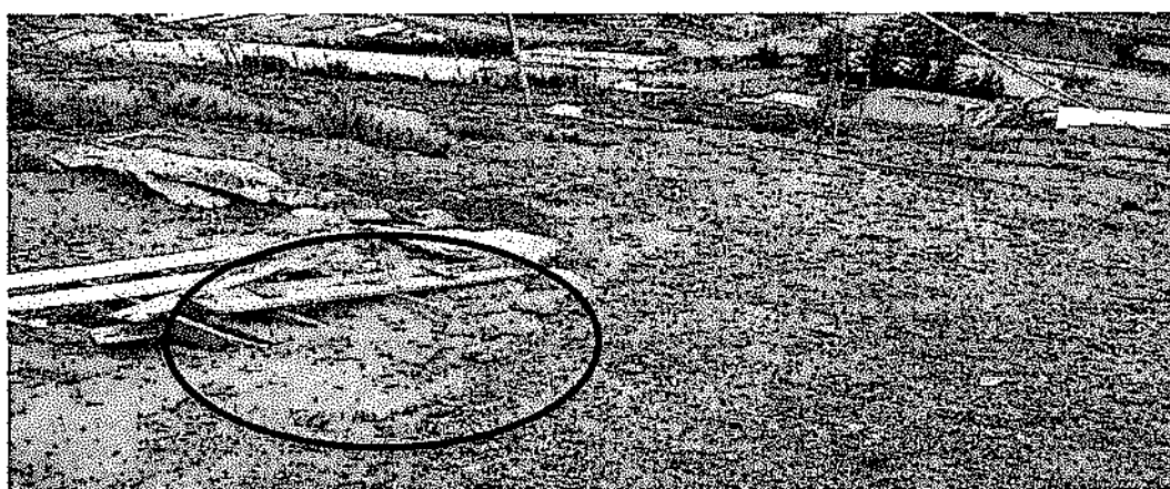
Foto N° 14-B: Afectación del medio natural, en la parte baja de la plataforma del nivel +100m, producto de las lamas que se descargaron por gravedad.