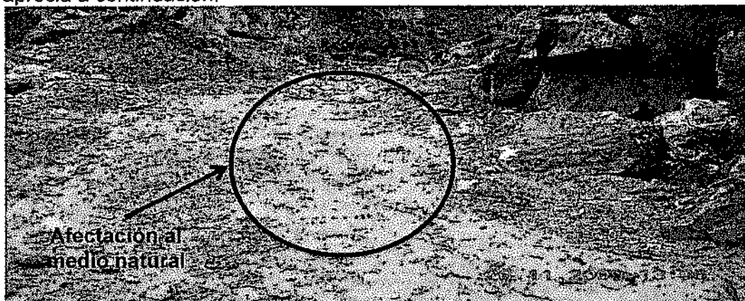
Foto N° 14-A: Vista de las lamas que se descargan por gravedad al medio natural, parte baja de la plataforma del depósito de mineral ubicado cerca de la bocamina del nivel +100.