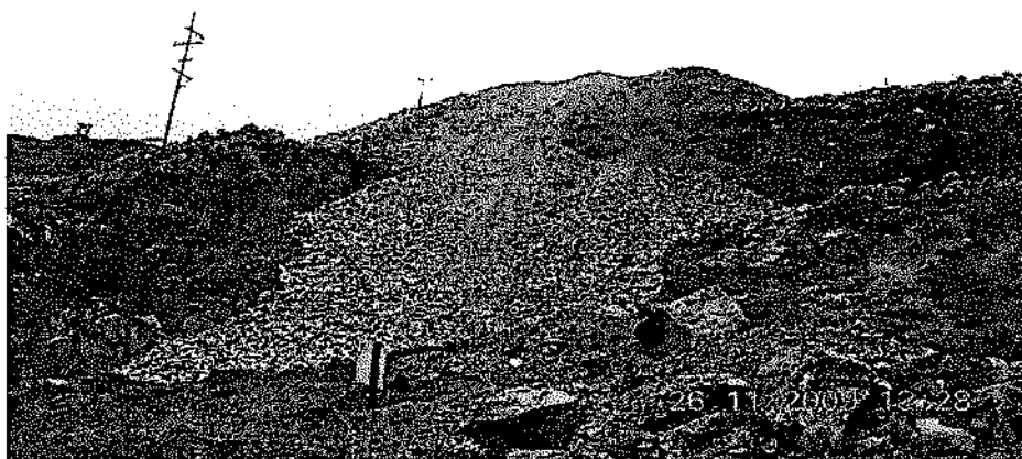
Fotografía N° 14.- Vista del talud del depósito de mineral ubicado en la bocamina del nivel +100