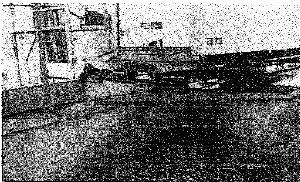
Foto N° 01: Recurso Anchoveta en poza de recepción durante el proceso realizado en la planta de harina residual de Agrofishing