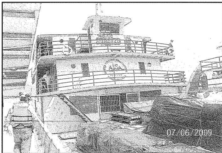
Fotografía N° 2: Se muestra la motochata fluvial San Lorenzo ubicada en la zona de alije durante la supervisión del 07 de junio de 2009.