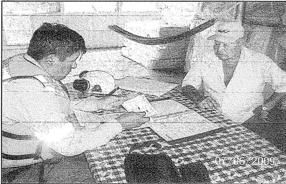
Fotografía N° 01.- Supervisor de Seguridad de Pluspetrol (con chaleco de seguridad) revisando los pases médicos de la tripulación de la Motochata San Lorenzo los mismos que están vencidos.