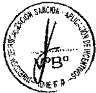
Cuadro N° 2