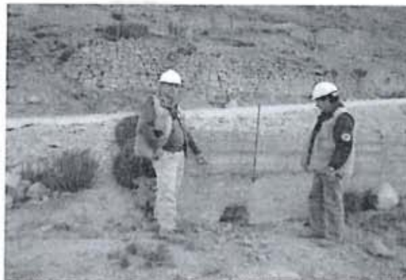
Fotografía N° 27: Disposición final de residuos sólidos industriales y peligrosos, se observa en la pared un orificio (ubicado en 8550410 N, 50574 E, Altura 463 msnm).