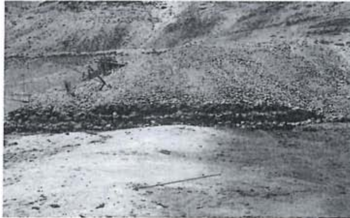
Recomendación N° 32.- Desmonte de la bocamina del nivel 520 de la zona Nancy Luz no cuenta con sistema de captación de aguas ácidas el que viene impactando al bofedal.