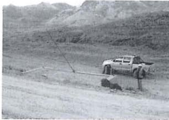
Fotografía N° 26: Disposición final de residuos sólidos industriales y peligrosos, ubicado en 8550410 N, 50574 E, Altura 463 msnm