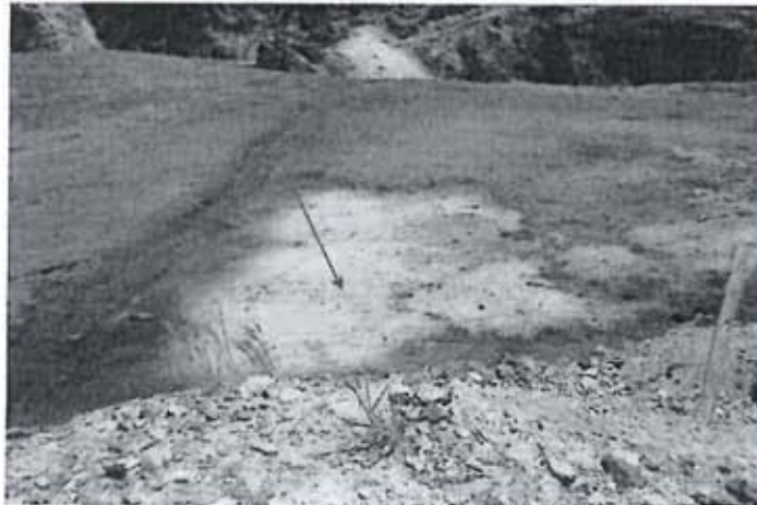
Recomendación N° 33.- Bofedal impactado por las aguas de escorrentías del Desmonte del la bocamina del nivel 520 de la zona Nancy Luz.