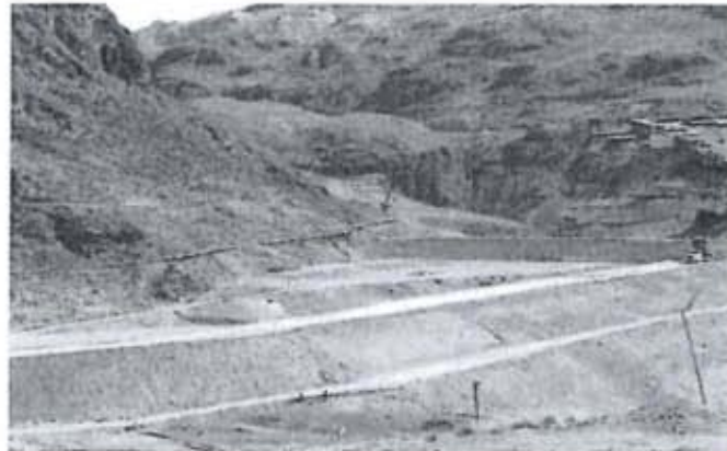
Recomendación N° 34- Las tuberías de retorno de agua entre la planta concentradora Corralpampa y el emplazamiento de las relaveras no cuentan con un sistema de contingencia.