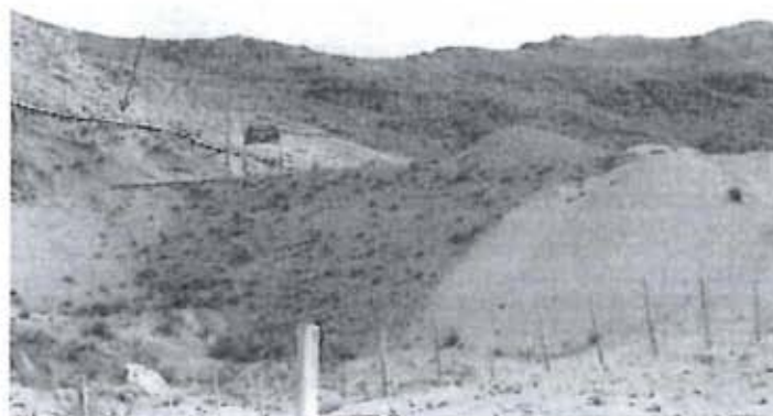
Recomendación N° 35- Las tuberías de retorno de agua entre la planta concentradora Corralpampa y el emplazamiento de las relaveras no cuentan con un sistema de contingencia.