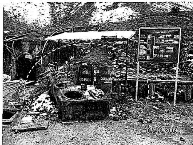
Deficientes prácticas de segregación de residuos en punto de acopio de residuos sólidos domésticos.