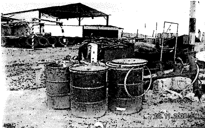
Foto N° II.14.3 Obs N° 3 (2009) Depósito temporal de almacenamiento de RRSS de la contrata Consorcio Pasco, el cual se encuentra en completo desorden.