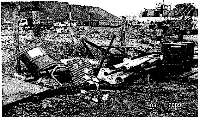
Foto N° II.14.4 Obs N° 4 (2009) El depósito de la contrata Consorcio Pasco no se encuentra señalizado, no hay clasificación. Falta Manejo