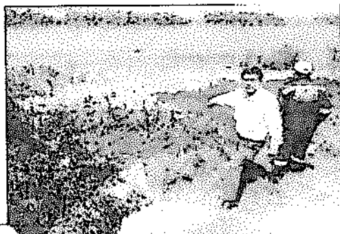
Zona inerte de flora y fauna por el impacto ambiental