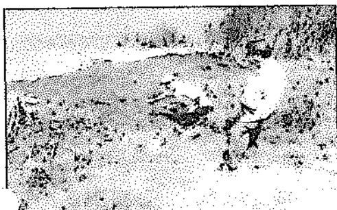
Zona dentro del río impactada con grasa y sólidos.