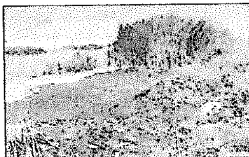
Aprox. 100m 3 de grasa y sólidos.