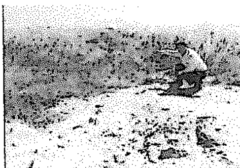
Tendido de tubería enterrada de la zona 27 de octubre hacia el río Lacramarca