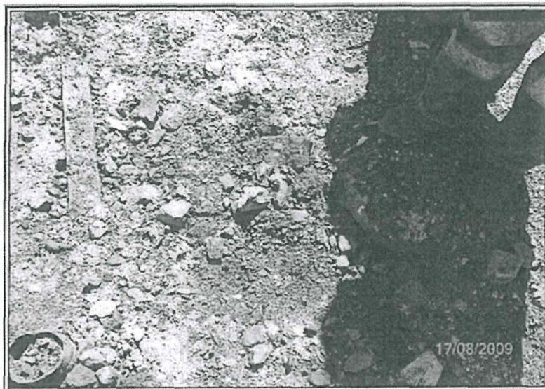
Foto19: Lev. Obs 12 (2008)

En el torno de la línea férrea por donde circulan los carros mineros del nivel 3810 de Huanzala Principal, se observa suelo impregnado con hidrocarburo.