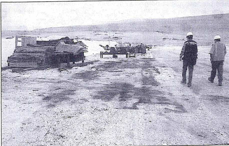
Fotografía C-02: Otra vista del área de almacenamiento de residuos sólidos, en la Planta de Coquina de la Unidad Ilo de SPCC, restos de concentrado dispersos.