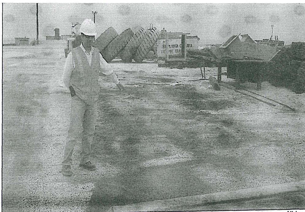
Fotografía C-01: En el área de almacenamiento temporal de residuos sólidos, correspondiente a la Planta de Coquina de la Unidad Ilo de SPCC, se observa restos de concentrado, el mismo que viene dispersándose al entorno.