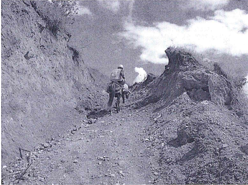
Caminos de herradura de acceso a la zona de Pindo, requieren de limpieza y mantenimiento