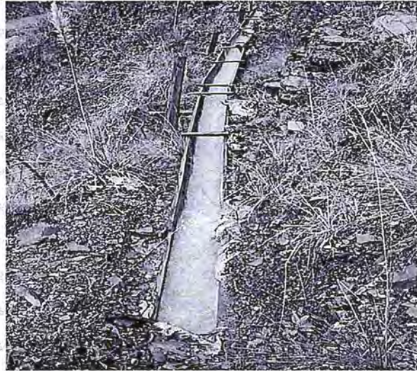
Foto N° 06: Canal de madera a la intemperie que transporta aguas de la bocamina Tingo.