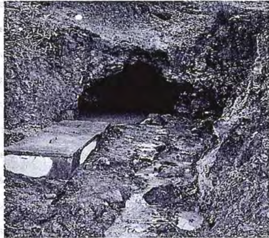
Foto N° 10: Bocamina Satélite 2. Observese el agua que rebose al ambiente por falta de mantenimiento y limpieza en la zona de captación.

no adoptó las medidas necesarias para impedir o evitar que el efluente proveniente de la bocamina Satélite 2 rebose al ambiente; además, de conformidad con lo verificado por la Supervisora en el ejercicio de sus funciones, se constató que el titular no cumplió con el mantenimiento y limpieza de la caja de captación, tal como se aprecia en la fotografías N° 10 y N° 11 contenida en el Informe de Supervisión: