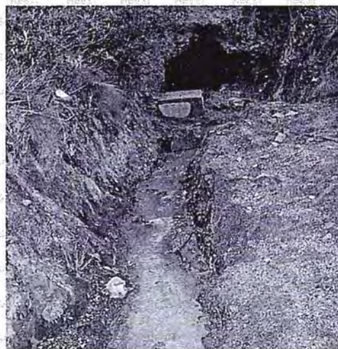
Foto N° 11: Aguas que rebosan de la bocamina Satélite 2 al ambiente, que no ingresan a la caja de captación de concreto.

Corona manifiesta en sus descargos lo siguiente: