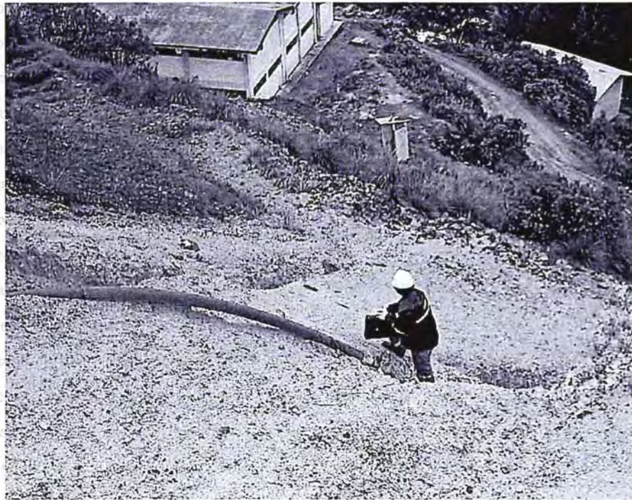
Foto N° 16: Chorro de agua que discurre sobre talud de depósito de desmonte Bella Unión.