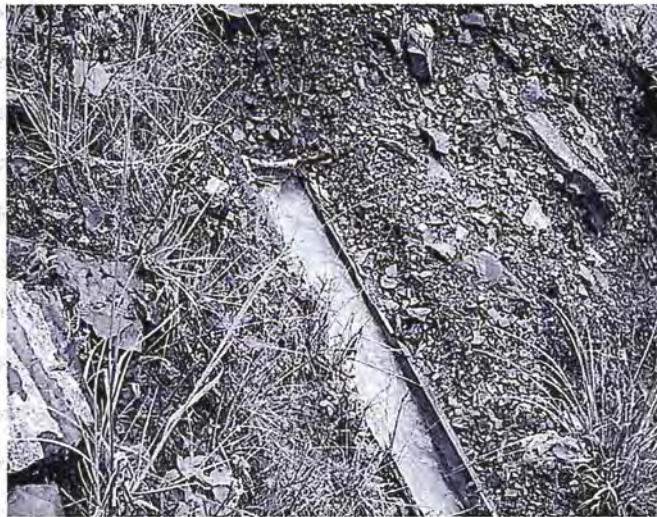
Foto N° 07: Parte final de la canaleta de madera donde se observan rastros que denotan la existencia de eventuales reboses.