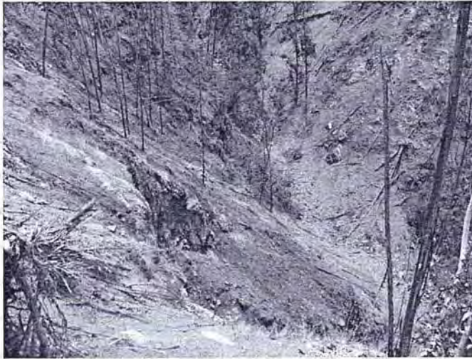
Fotografía N° 04:

Ello se evidencia con las vistas fotográficas N° 3 y 4 (folios 28 y 29):