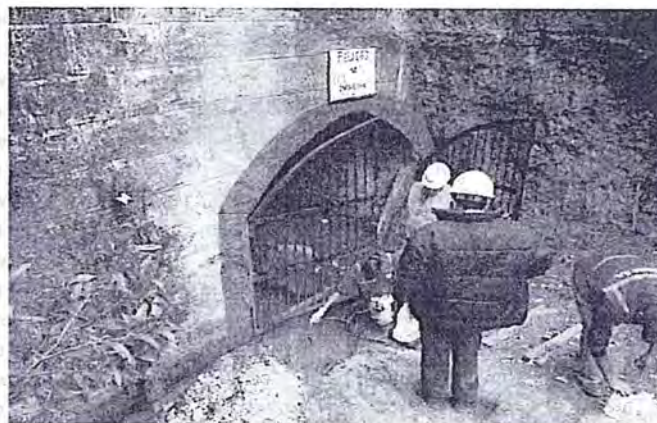
"Foto N° 37: Estación 604, Bocamina Pucará" (folio 69 del expediente N° 096-08-MA/R).