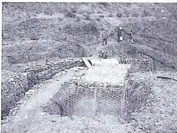
“Foto N° 43: Muro de contención de piedra al pie del depósito de desmonte N° 3 en la Quebrada Azalia” (folio 72)

32. Respecto de lo indicado por Activos Mineros en el párrafo anterior, cabe reiterar lo indicado en el párrafo 27, en el sentido que se ha verificado que Activos Mineros implementó un sistema de contención en la Quebrada Azalia, cumpliendo de tal modo, la obligación contemplada en la Recomendación 05; lo cual se evidencia en la fotografía N° 43 (folio 72 del expediente N° 096-08-MA/R):