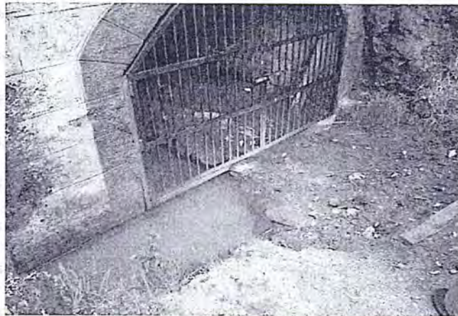
"Foto N° 21: Bocamina del Túnel Pucará" (folio 61 del expediente N° 096-08-MA/R).