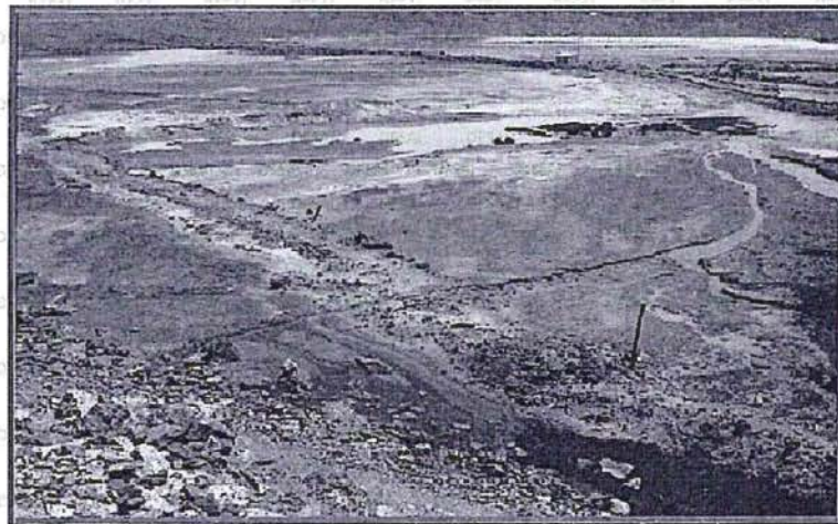
"Fotografía N° 64: (...) Acumulación de agua en el interior del depósito de relave N° 3, a consecuencia del ingreso del efluente de la bocamina del Nv 500 Norte -El Poderoso." (folio 79)

36. Asimismo, cabe indicar que del análisis del Informe de Supervisión, se aprecia un cuadro de evaluación de componentes de la unidad "Huarón", en el cual la Supervisora se pronuncia sobre el depósito de relaves (folio 13), según el siguiente detalle: