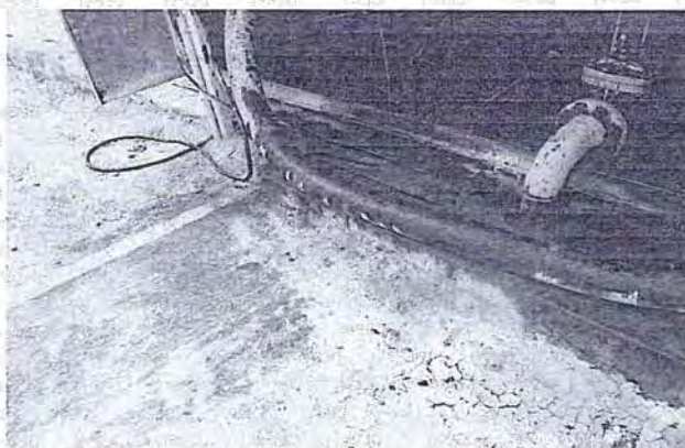
Foto N° 54: Otra vista del punto de descarga de los cisternas que traen combustible, donde el sistema de contención requiere mejorar para evitar impactar suelos naturales.