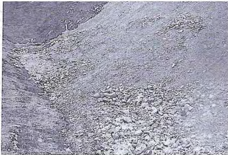
Foto N° 51: Parte baja del talud del depósito de desmontes, donde parte de la quebrada está siendo cubierta por material de desmonte.