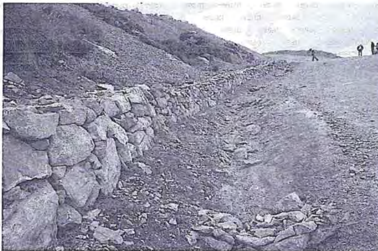
Foto N° 50: Muro de piedra paralelo a la cuneta que se utiliza como contención, en ciertos tramos el material de la cantera lo rebose.