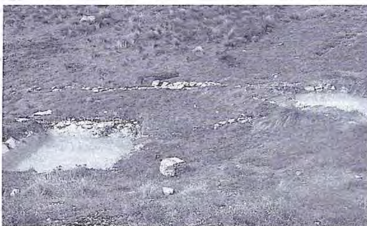
Foto N° 55: Pozas de sedimentación (en total 5), construidas de piedra y cemento, que sirven para controlar los sólidos de las aguas provenientes de la planta de chancado.