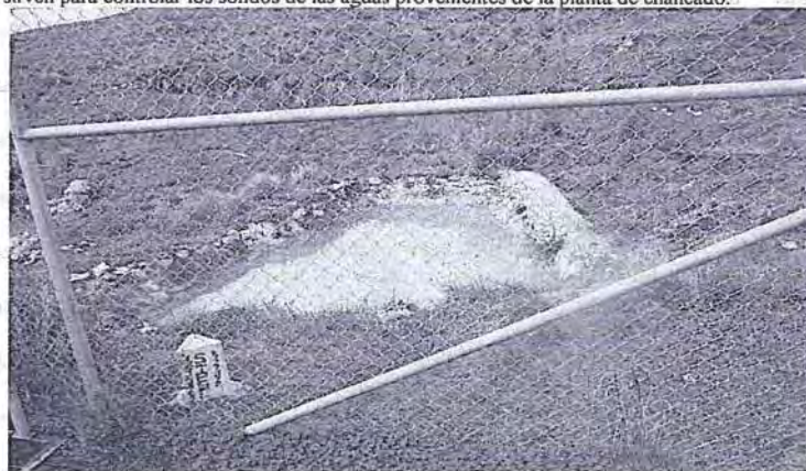
Foto N° 56: Última poza de sedimentación, cuyas aguas clarificadas descargan a la quebrada, por lo que se monitoreo durante la supervisión.