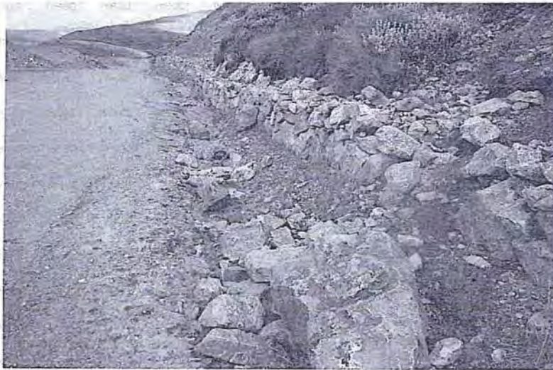
Foto N° 49: Muro de piedra paralelo a la cuneta que se utiliza como contención, se encuentra desmoronado por tramos.