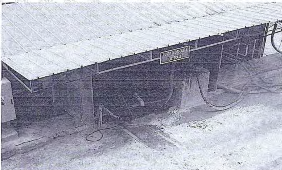
Foto N° 53: En el punto de descarga de los cisternas que traen combustible, el sistema de contención ante posibles derrames no cubre la totalidad del área asignada para la descarga del combustible.