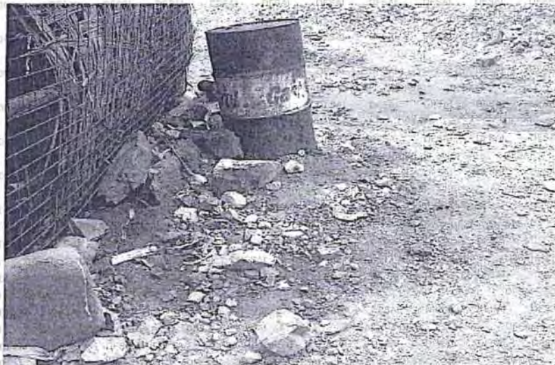
Foto N° 23: El la parte externa del almacén de hidrocarburos se observa un cilindro de hidrocarburos a la intemperie, asimismo se observa derrame de éste material peligroso contaminando el suelo y agua subterráneas.