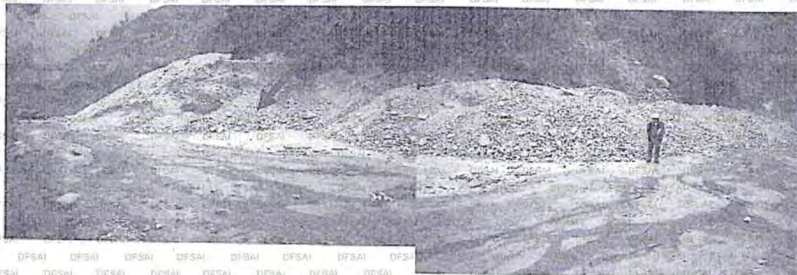
Foto N° 28: Botadero de desmonte, la flecha en la vista anterior indica la zona en la que se observa la pila de desmonte contigua y en el suelo discurre agua y en otras se observa agua estancada con presencia de renacuajos y batracios pequeños.

31. Al respecto, Golden Mine no ha desvirtuado dicho incumplimiento, por lo cual, a tenor de lo establecido en el artículo 165° de la LPAG (el cual otorga validez probatoria a los hechos comprobados con ejercicio de la función supervisora), y de