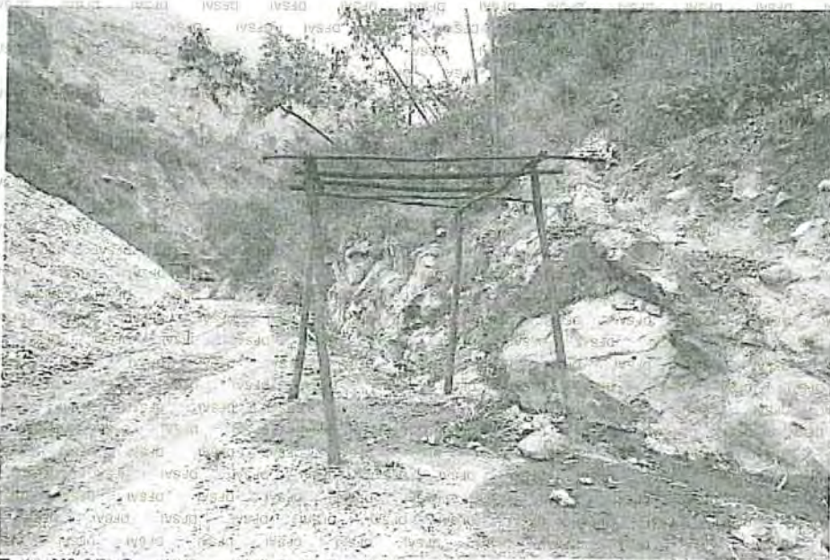
Foto N° 25: Se observa la infraestructura de material prefabricado, de protección para la compresora, también se observa derrame de hidrocarburos en el suelo, observar al costado derecho el efluente minero con agua de escorrentía.