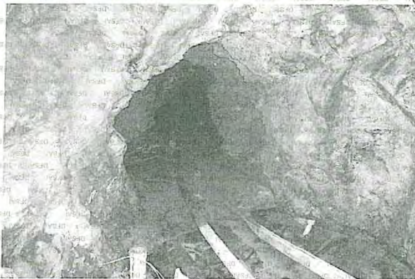
Foto N° 47: Primera bocamina subterránea, se encuentra inundado, se observa materiales en desuso remojándose, rieles tuberías, botas, costalillo y bolsas en desuso.