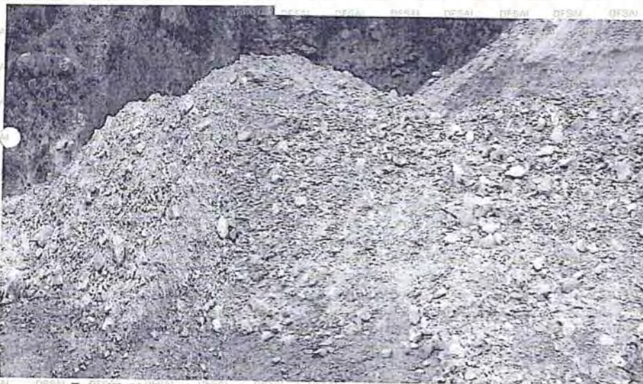
Foto N° 26: Botadero de material de mina subterránea en la zona en la quebrada Sincay y Punzo.