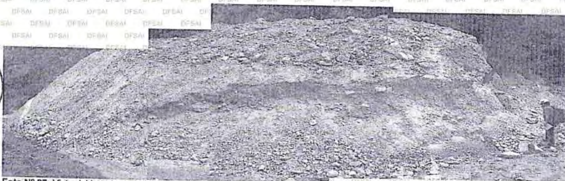
Foto N° 27: Vista del botadero de desmonte, observar que la técnica de voladura no ha sido la adecuada, la mayor parte de la granulometría del material de mina esta molido, lo que es más fácil su meteorización química, asimismo el talud de reposo esta sobre los 45°.