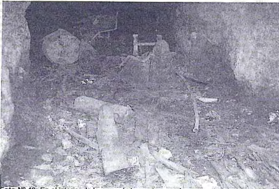
Foto N° 49: En el interior de la segunda bocamina, se observa materiales en desuso.

36. Con la finalidad de verificar el cumplimiento de las obligaciones contempladas en el artículo 6° del RAAEM, en la visita de supervisión especial llevada a cabo en la Concesión "Mercedes 3L", se constató que en el interior de la segunda bocamina existen materiales en desuso, impactando con suelo natural. Dicha afirmación se sustenta en la fotografía N° 49 obrante a folio 65.