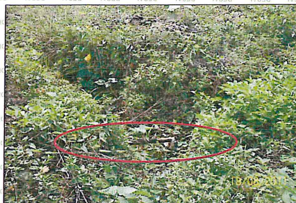
Fotografía N° 3 En la zona Norte-Oeste de las instalaciones de la Ex. Planta de Ventas, colindante con propietarios terceros, se observa restos de tuberías de aproximadamente 2" de diámetro, en aparente estado de corrosión que se encuentran ocultos por la vegetación propia de la zona