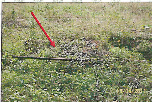
Fotografía N° 2. Ampliación de la vista anterior. En la zona Norte-Oeste de las instalaciones de la Ex. Plata de Ventas, colindante con propietarios terceros, se observa restos de tuberías de aproximadamente 2" de diámetro, en aparente estado de corrosión.