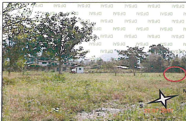
Fotografía N° 1: Vista panorámica del ingreso a la Ex. Planta de Ventas. En la zona Norte se observa restos de tuberías de aproximadamente 2" de diámetro

43. Dicha observación es verificable con las fotografías N° 1, N° 2 y N° 3 obrantes a folios 247 y 248 del Expediente, tal como se muestra a continuación: