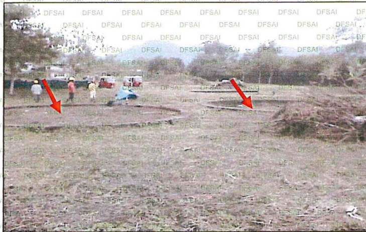
Fotografía N° 4 Vista Panorámica de la ubicación de los 3 anillos correspondientes a los tanques de almacenamiento de combustible. Fotografía tomada antes del inicio de los trabajos de demolición de estructuras de concreto

56. De acuerdo a lo antes señalado, se comprueba que la empresa PETROPERU incumplió con el compromiso ambiental asumido en su Plan de Abandono, lo cual a su vez constituye un incumplimiento al literal b) del artículo 89° del RPAAH.