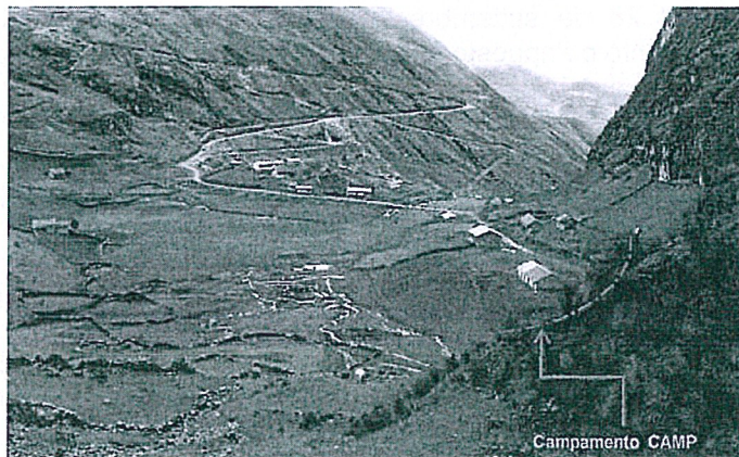
Fotografía N° 59: Hallazgo N° 1, Vista panorámica del Campamento CAMP en el Poblado Malpaso, ubicado en la zona San Jorge, con coordenadas UTM (WGS 84), E: 359721 N: 8853009, se observa las dos edificaciones de adobe con techos de calamina.