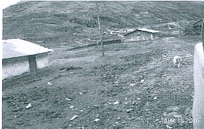
Fotografía N° 58: Hallazgo N° 1, Otra vista del Campamento CAMP (Poblado Malpaso) ubicado en la zona San Jorge, con coordenadas UTM (WGS 84), E: 359721 N: 8853009, se observa dos instalaciones de adobe con techo de calamina; donde no se ha realizado las actividades de cierre.