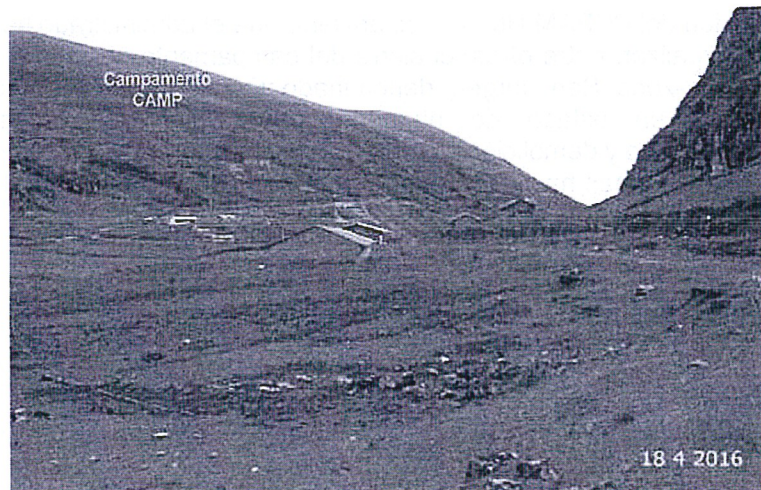
Fotografía N° 57: Hallazgo N° 1, Vista del Campamento CAMP (Poblado Malpaso) ubicado en la zona San Jorge, con coordenadas UTM (WGS 84), E: 359721 N: 8853009, se observa dos edificaciones de adobe con techo de calamina, con vegetación a su alrededor.