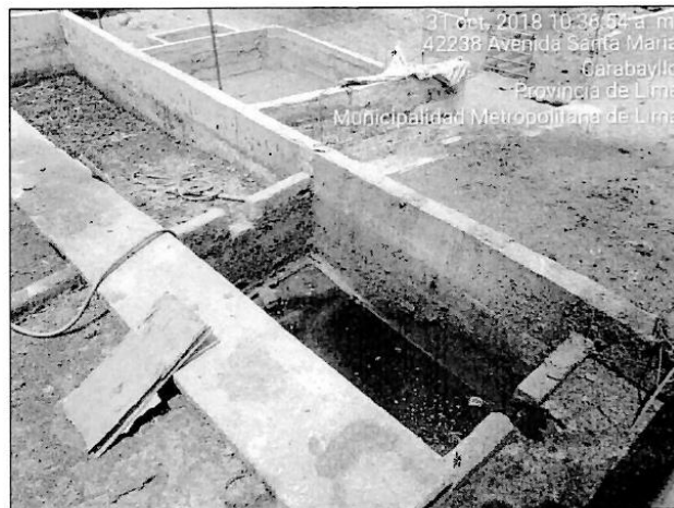
Fotografía N° 09: Vista fotográfica de la Planta de tratamiento de aguas residuales no funcional de la empresa SERVICIOS AGROPECUARIOS GANADEROS E INDUSTRIALES S.A. (S.A.G.E.I.S.A.), ubicado en las coordenadas geográficas UTM WGS 84 – Zona 18 L: Norte 8689128, Este 278213.