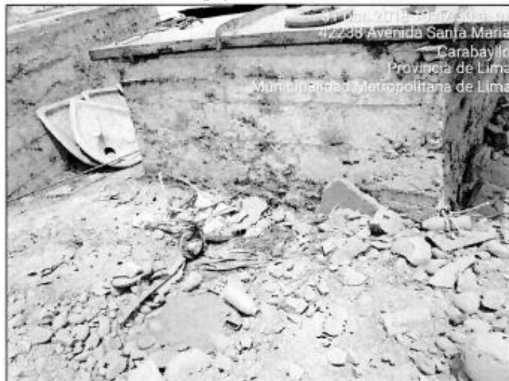
Fotografía N° 11: Vista fotográfica de la inadecuada disposición de residuos sólidos inorgánicos (sogas, alambres, materiales de construcción, botellas de vidrio, bolsas plásticas, etc.), de la empresa SERVICIOS AGROPECUARIOS GANADEROS E INDUSTRIALES S.A. (S.A.G.E.I.S.A.), ubicada en las coordenadas geográficas UTM WGS 84 – Zona 18 L: Norte 8689158, Este 278214.

La mencionada Acta de Supervisión, determinó que el administrado abandonó, dispuso y eliminó residuos sólidos no peligrosos en lugares no permitidos; advirtiéndose materiales de construcción, sogas, alambres, botellas de vidrio, bolsas plásticas, entre otros, de acuerdo a lo siguiente