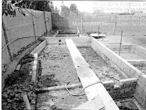
Fotografía N° 08: Vista fotográfica de la Planta de tratamiento de aguas residuales no funcional de la empresa SERVICIOS AGROPECUARIOS GANADEROS E INDUSTRIALES S.A. (S.A.G.E.I.S.A.), ubicado en las coordenadas geográficas UTM WGS 84 – Zona 18 L: Norte 8689128, Este 278213.