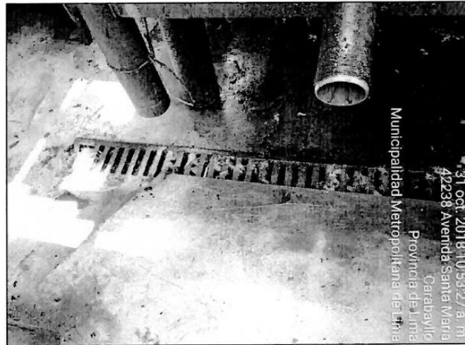
Fotografía N° 10: Vista fotográfica de las aguas residuales propias del proceso de faenado derivan directamente al alcantarillado de la empresa SERVICIOS AGROPECUARIOS GANADEROS E INDUSTRIALES S.A. (S.A.G.E.I.S.A.), ubicado en las coordenadas geográficas UTM WGS 84 – Zona 18 L: Norte 8689162, Este 278247.