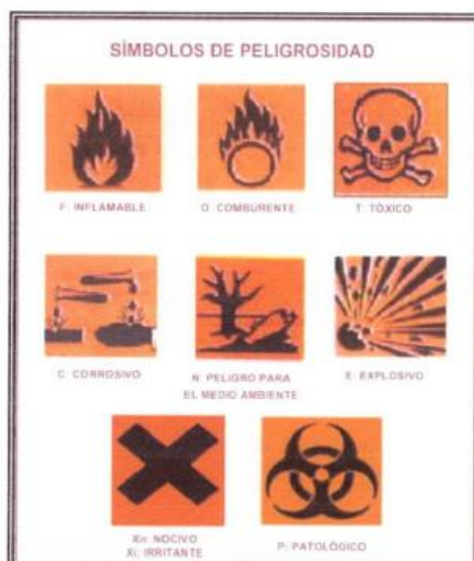
Figura Nº 02 - Símbolos de peligrosidad para los residuos sólidos