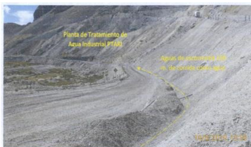
Fotografía N° 5: Se observa recorrido de las aguas de no contacto ó aguas de escorrentía captadas en el canal de coronación de vía a la mina en un tramo de 150 m., mediante un canal de tierra.