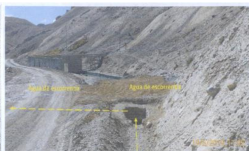
Fotografía N° 6: Se muestra la construcción de una poza desarenadora que capta las aguas de escorrentía para drenar de forma independiente hacia la laguna esperanza, sin entrar en contacto con las aguas de tratamiento de la PTARI.