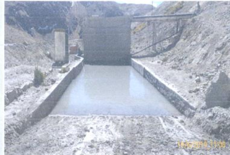
Fotografía N° 8: Vista panorámica de la rampa de descarga de lodos en la PTARI. Observe se encuentra impermeabilizado con concreto.