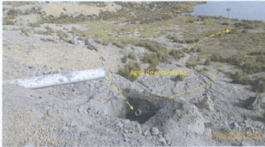
Fotografía N° 7: Cruzando la carretera vía a la Mina, se observa poza desarenadora que recepciona el agua de escorrentía sedimenta los finos, para luego descargar a la Laguna Esperanza.