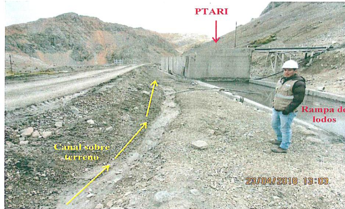
FOTOGRAFÍA N° 32.- Adyacente a la rampa de lodos de la PTARI se observó un canal sobre terreno el cual se encontraba proyectado desde el canal de coronación (agua de no contacto) de la unidad minera Heraldos Negros.