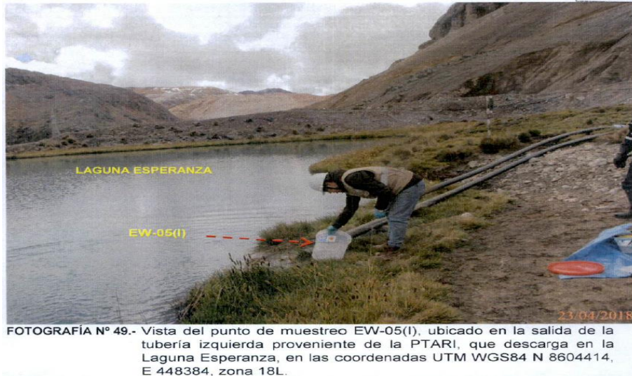
FOTOGRAFÍA N° 49.- Vista del punto de muestreo EW-05(i), ubicado en la salida de la tubería izquierda proveniente de la PTARI, que descarga en la Laguna Esperanza, en las coordenadas UTM WGS84 N 8604414, E 448384, zona 18L.