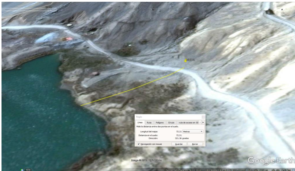
Imagen N° 1