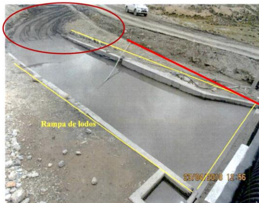
FOTOGRAFIA N° 30.- PTARI, adyacente a la PTARI, se encontraba una rampa de lodos el cual era usada, para depositar de forma transitoria, los lodos que generaba la PTARI