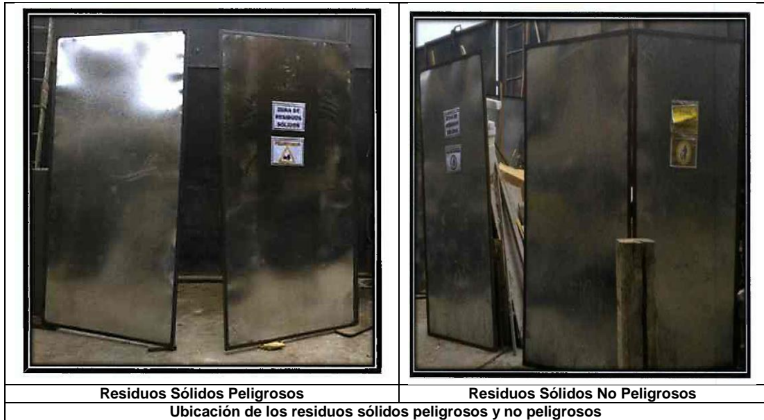
Fuente: Escrito del 20 de junio del 2019 (Registro N° 2019-E01-60917)