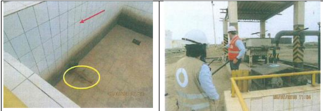
Vista panorámica de la Poza de efluentes líquidos, dentro de la instalación de Terminal Salaverry. Se observa en el interior de la poza, que esta se encuentra completamente vacía y cuenta con una brida ciega instalada en el pinto de descarga proveniente de las pozas API N° 1 y 2 con lo cual no existe descarga de efluentes líquidos hacia el exterior.