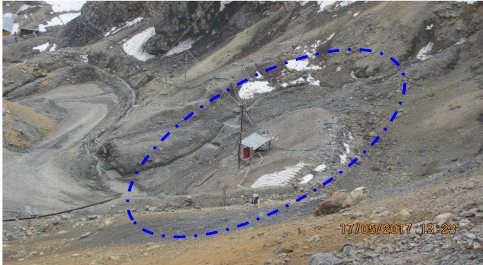
Fotografía N° 3: Manejo de los afloramientos de agua proveniente de los deshielos. Vista de la plataforma de acceso a la bocamina del Nivel 4890, construido con los desmontes antiguos . En la zona adyacente al punto de coordenadas UTM Datum WGS 84 – Zona 18: 448891E, 8603971N, se constató un afloramiento de agua que se encausaba en un canal sin impermeabilización.