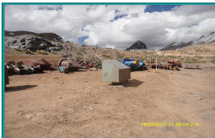
Fotografía N° 66a: Disposición de residuos sólidos industriales. En la vista se observa que en el área de disposición de residuos sólidos industriales se encontraban dispuestos partes de equipos de planta concentradora y motores eléctricos.