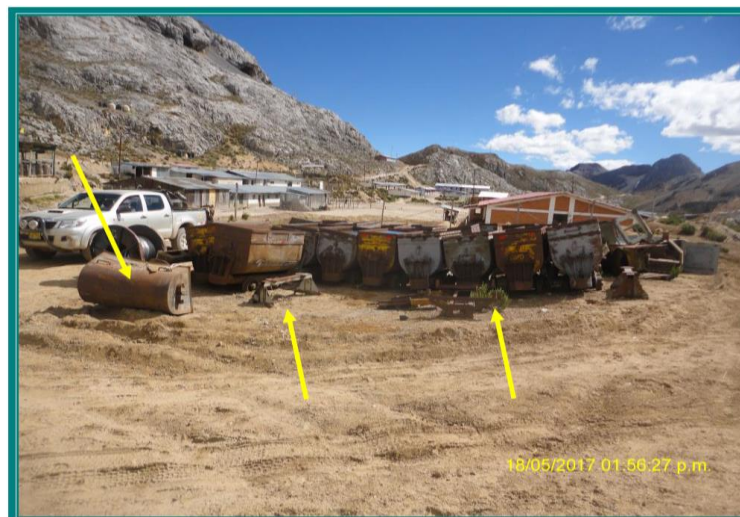
Fotografía N° 66b: Disposición de residuos sólidos industriales. En la vista se observa que el área de disposición de residuos sólidos industriales está ubicado adyacente al campamento de obreros y se encontraban depositados las tolvas y chasis de los carros mineros en desuso.