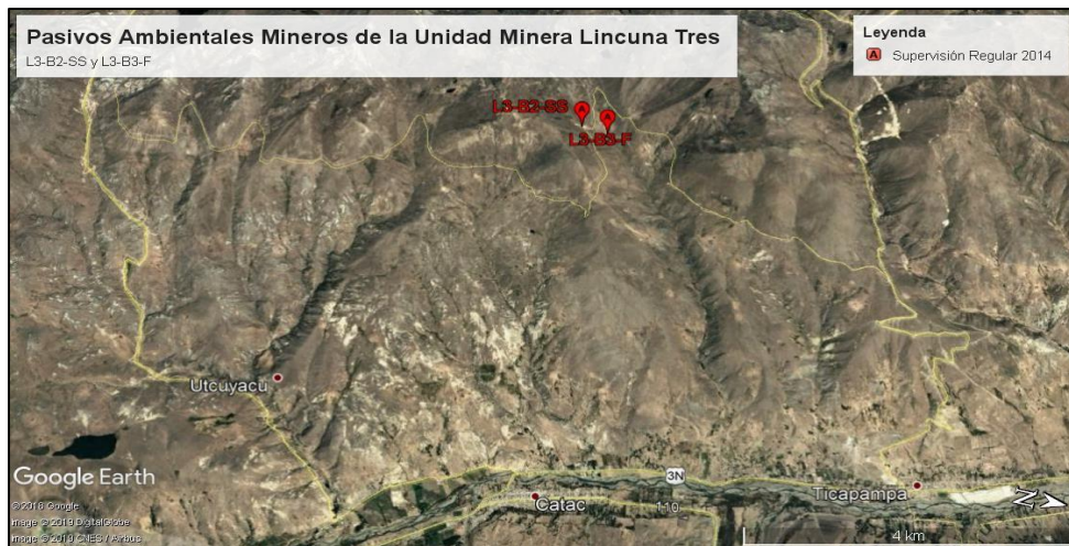
Elaboración: Dirección de Fiscalización y Aplicación de Incentivos del Organismo de Evaluación y Fiscalización Ambiental