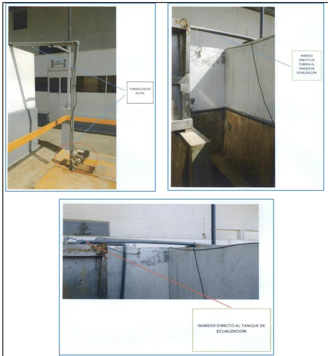
Captura N° 2: Escrito con Registro N° 2019-E07-051758