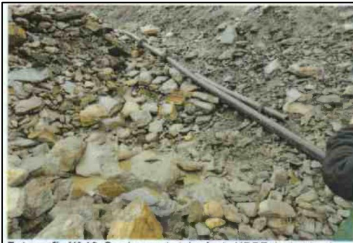
Fotografía N° 12: Se observa la tubería de HDPE de 4 pulgadas proveniente de la poza de decantación con dirección a la poza de relave, la cual habría presentado una fuga de agua decantada, por lo que el titular minero reemplazó la parte de dicha tubería que presentaba la fuga.