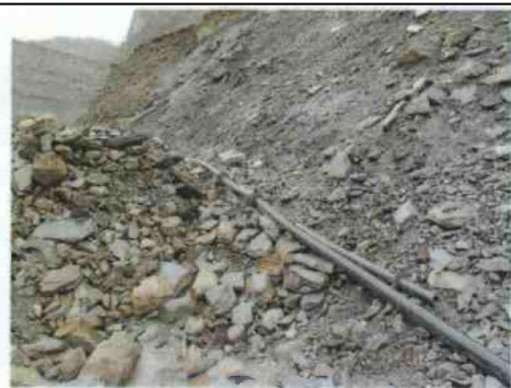
Fotografía N° 15: Se observa que la tubería de HDPE de 4 pulgadas presentó una fuga de agua decantada impactando el suelo natural de la falda del cerro por donde cruzaba dicha tubería, motivo por el cual el administrado sustituyó la tubería que presentaba la fuga por otra.