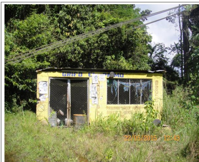
Fotografía N° 1. Vista del Grifo Rural con Almacenamiento en Cilindros de la empresa MULTISERVICIOS EL PRIMO E.I.R.L., ubicado en Sector Granjita Carretera Pillcopata – Salvación, distrito Kcosñipata , provincia Paucartambo y departamento del Cusco.

Decenio de la Igualdad de Oportunidades para Mujeres y Hombres Año de la Lucha contra la Corrupción y la Impunidad