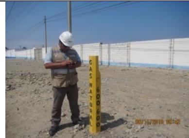
Hito de señalización identificado como: Gas natural 600 600, que indica que existe la matriz de distribución de gas natural (ubicado aproximadamente a 35 metros del portón de ingreso del administrado). Coordenadas 0365934E y 8474466N