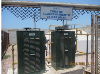
Zona de almacenamiento de Gas Licuado de Petróleo (GLP)