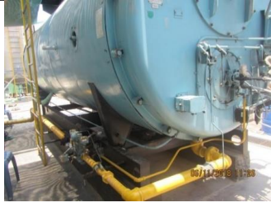
Caldero accionado con Gas Licuado de Petróleo (GLP)