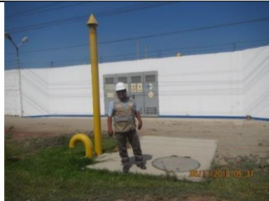
Estación de regulación de medición de gas natural perteneciente a otro EIP. Coordenadas 0365905E y 8474271N