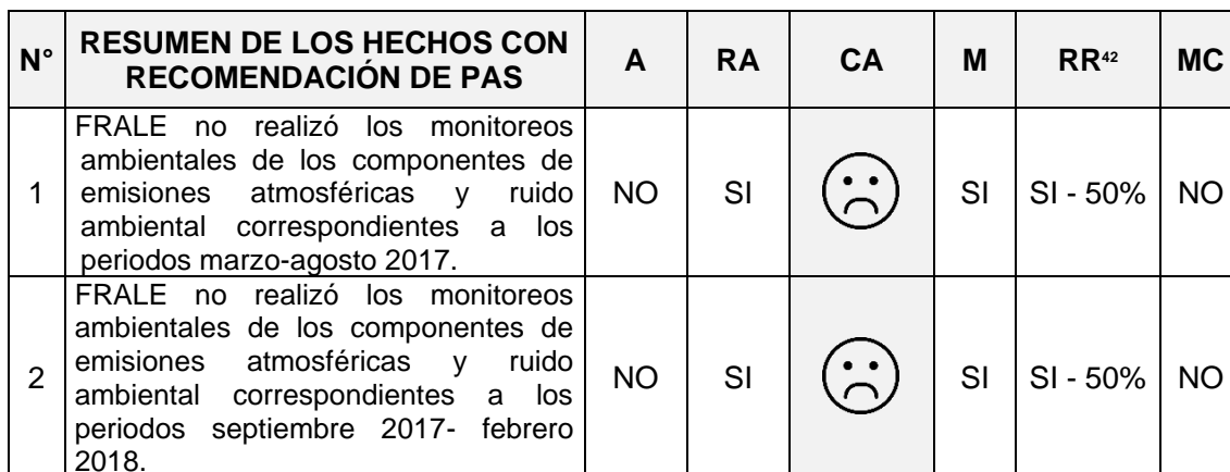
Tabla N° 1: Resumen de lo actuado en el expediente

durante el desarrollo de sus actividades económicas; por ello usted encontrará en la siguiente tabla un resumen de los aspectos de mayor relevancia, destacándose si la conducta fue o no corregida.