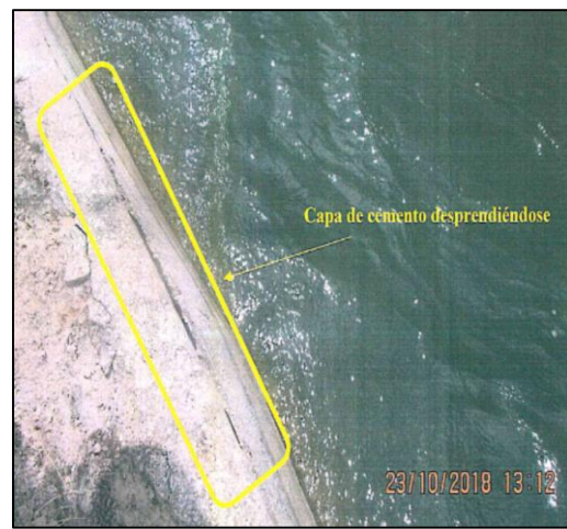
Fotografía H1-10 del Informe de Supervisión. Vista de parte del canal de conducción donde se observa el desprendimiento de la capa superficial de concreto el cual podría generar infiltraciones por esas zonas.