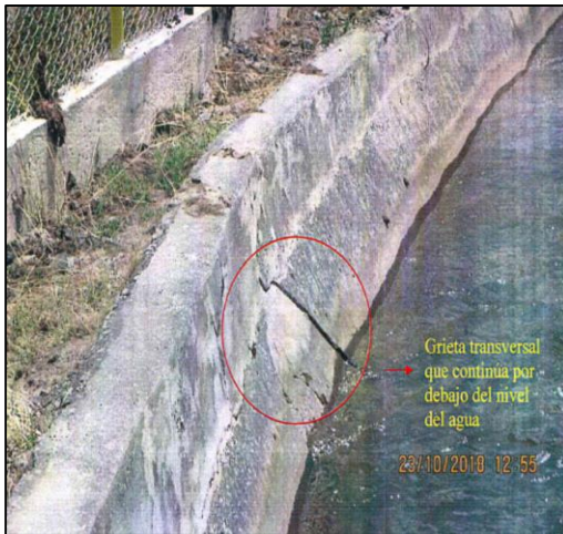
Fotografía H1-9 del Informe de Supervisión. Vista del canal de conducción con paredes agrietadas y desprendimiento de la capa superficial de concreto.