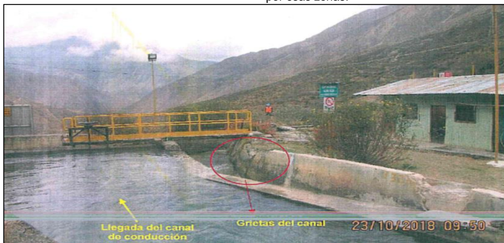
Fotografía H1-11 del Informe de Supervisión. Vista de cámara de carga de la CH Cashaucro, donde se observa las paredes agrietadas del canal de demasías, el cual podría generar infiltraciones por esas zonas.