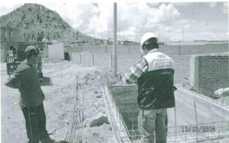
Foto N° 05: Verificación de la Isla 02 ('Isla pequeña'), en la cual se ha observado que está en regeneración.