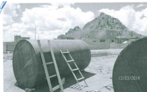
Foto N° 06: Refacción (según la administradora encargada del establecimiento) de los tanques de almacenamiento de combustible.