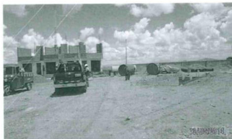
Foto N° 01: Vista panorámica del Establecimiento Grifo Las Palmeras, ubicado en la Km. 10.4 Carretera Juliaca - Huanacané, distrito de Juliaca, provincia de San Román y región de Puno.