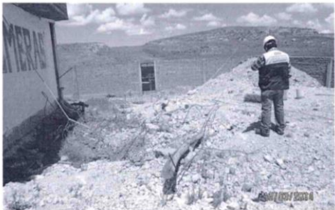
Foto N° 03: Se observa residuos no peligrosos esparcidos por el establecimiento, demostrando que no se realiza segregación de los RRSS no peligrosos.