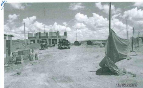
Foto N° 02: Vista panorámica del establecimiento donde no se evidencia la implementación de contenedores (tachos) para disposición de RRSS temporal (peligrosos y no peligrosos).