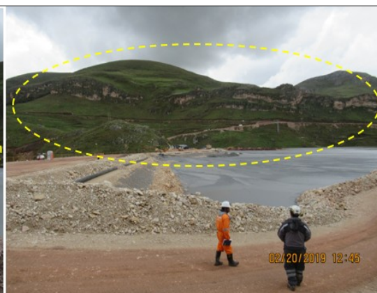
Fotografía N° 20: Depósito de relaves El Porvenir, otra vista donde se observa que en el depósito no se habían iniciado las actividades de construcción del canal temporal de coronación, canal de coronación y alcantarilla.