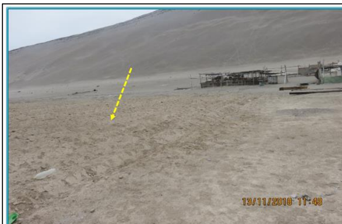
Fotografía N° 155: Otra vista de las parcelas para cultivos cercana a la zona de Almacén (DIA 2017) y la carretera principal. Se observa un envase de plástico dentro de dicha parcela.