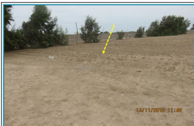
Fotografía N° 154: Vista de parcelas para cultivos cercana a la zona de Almacén (DIA 2017) y la carretera principal. Se observa un envase de plástico dentro de dicha parcela.