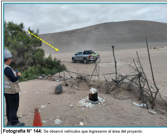
Fotografía N° 144: Se observó vehículos que ingresaron al área del proyecto.