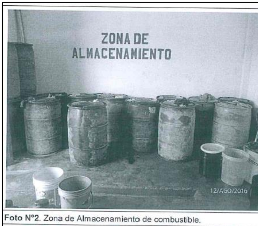
Imagen N° 3: Hallazgo detectado durante Supervisión Regular 2016