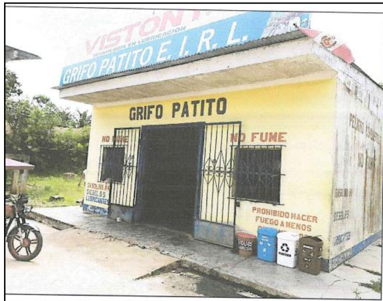
Imagen N° 4: Escrito de descargos

Decenio de la Igualdad de Oportunidades para Mujeres y Hombres Año de la Lucha contra la Corrupción y la Impunidad