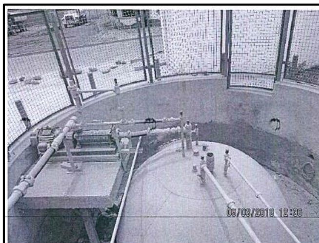
Fotografía N° 4: Vista del tanque de almacenamiento de GLP de inversiones Casalla S.A.C., en donde se puede apreciar que cuenta con un motor y su bomba. Asimismo, se puede observar que cuenta con conexiones de tuberías.

Página 3 del archivo denominado "DRI_6-3-18_20180628155107036" contenido en el CD obrante en el folio 5 del expediente.