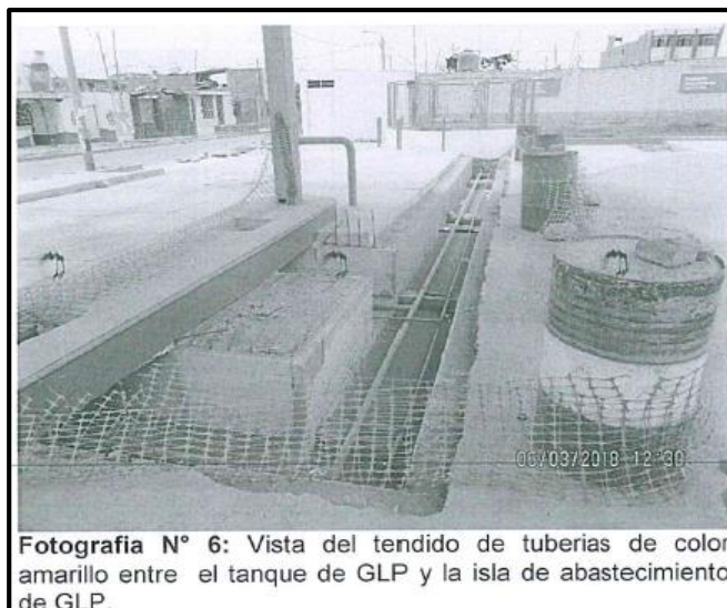
Fotografía N° 6: Vista del tendido de tuberías de color amarillo entre el tanque de GLP y la isla de abastecimiento de GLP.

Página 5 del archivo denominado "DRI_6-3-18_20180628155107036" contenido en el CD obrante en el folio 5 del expediente.