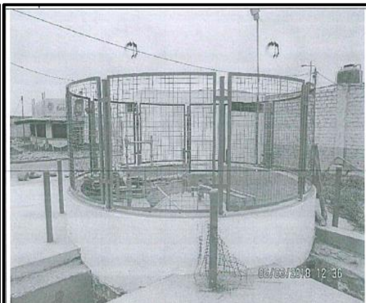
Fotografía N° 2: Vista del tanque de almacenamiento de GLP, instalado en las instalaciones de Inversiones Casalla S.A.C.; asimismo, se observa que el tanque de GLP cuenta con un cerco perimetrico de concreto.

Página 3 del archivo denominado "DRI_6-3-18_20180628155107036" contenido en el CD obrante en el folio 5 del expediente.