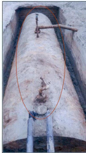
FOTOGRAFÍAS DE TANQUE N° 02 DE 6000 GALONES