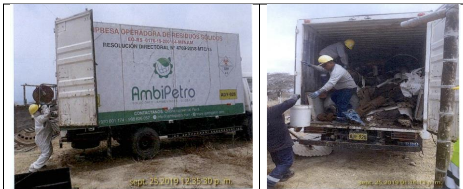
Imagen N°. 3. Actividades de recolección de Residuos Sólidos Peligrosos