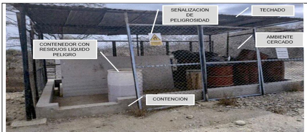
Imagen N°. 1. Vista del Almacén temporal de residuos peligrosos