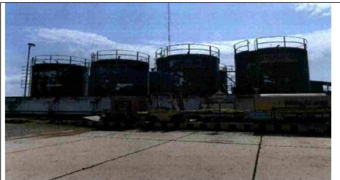
Registro Fotográfico N° 2. Vista Panorámica de la zona en donde se ubican los 12 tanques, los cuales se encuentran inoperativos desde el año 2012 de acuerdo a lo informado por el administrado. (Coordenadas UTM GS 84: 9349393N – 377447E)