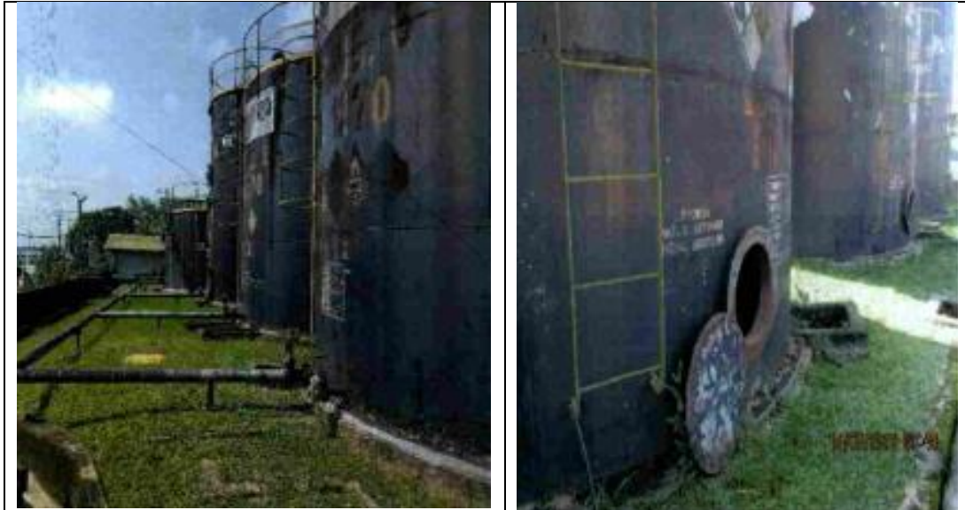
Registro Fotográfico N° 1. Se aprecia que los mencionados tanques no han sido desmantelados ni retirados de la Planta de Ventas. Asimismo, aparentemente se encuentran inoperativos. (Coordenadas UTM GS 84: 9349415N – 377450E)

advirtió la presencia de doce (12) tanques, tuberías y los respectivos accesorios instalados en la Planta de Ventas operada por el administrado 18 , conforme se evidencia en los siguientes registros fotográficos: